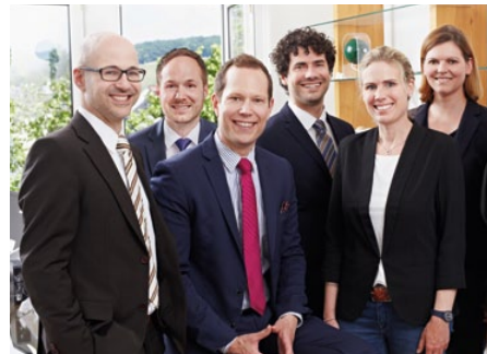
Das wünscht Ihnen das Team des Stiftungsführers

Viel Spaß beim Eintauchen in die Vielfalt der Stiftungswelt des Nordens und intensive, gute Gespräche.